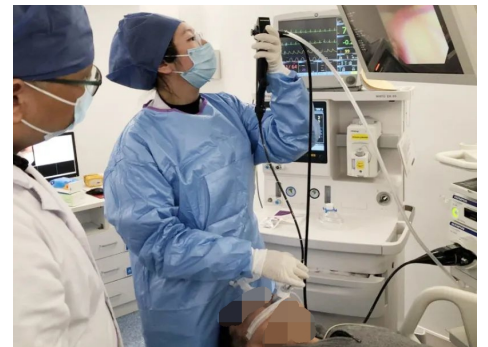
3月29日 我院呼吸与危重症医学科联合麻醉科、内镜中心成功开展首例无痛支气管镜检查