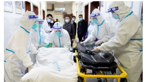
4月1日 我院急诊科开展新冠肺炎应急处置演练活动