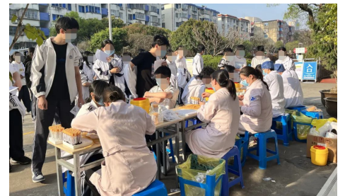
3月14日 我院开展椒江区高校招生体检,送检到校,助力高考