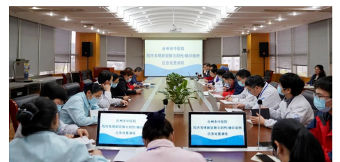
3月23日 我院开展院内发现新冠肺炎阳性病例应急处置模拟演练