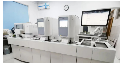
3月1日 我院迎来检验新设备——全自动血液细胞分析仪